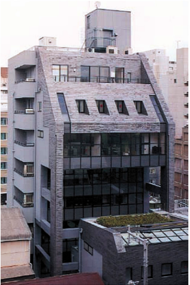
大美建築ビル (設計施工:大美建築)