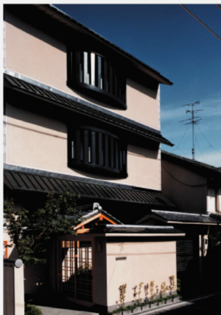
濱見邸:旧城下町の町並保存地区にある家。 (設計:IKE建築環境設計)

少子化・高齢化社会の到来を迎え、それぞれの家族に合わせて長期的な人生設計を考えなくてはならない時代に入りました。子どもはやがて巣立ち、夫婦二人になるときが、意外に早く来ます。そして、自らが高齢になったときのことを考慮し、バリアフリー住宅にしておく必要もあります。まさしく家づくりは、そこに住まう家族ひとりひとりの人生を見直すことにもなります。生活の舞台でもある住宅を住まう人と一体となって考えていきます。