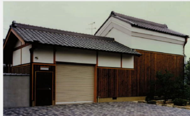
福井邸:門屋と蔵を増築。(設計施工:大美建築)