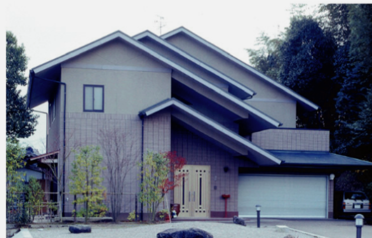
辻本邸:高台に建つ家。 (設計施工:大美建築)