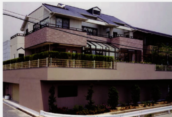
森田邸:箕面の住宅街でひととき目を引く住宅。(設計施工:大美建築)