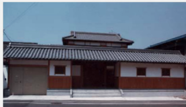
皆見邸:門長屋を持つ家。(設計:集建築工房)